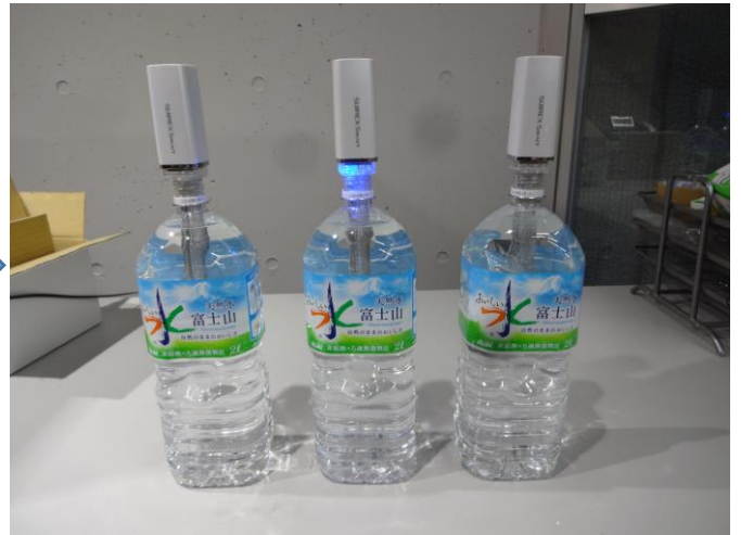
スアレックススマートで20分 還元